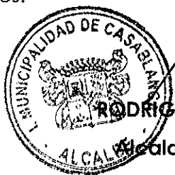
RODRIGO MARTINEZ ROCA Alcalde de Casablanca